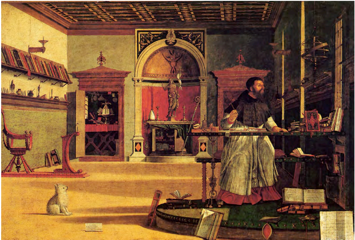
Abb.4 Carpaccio: Vision des Hl Augustinus 1502

Endgültig und unübersehbar betreten ist dieser Weg dann auf dem Wandbild „Vision des Hl Augustinus“, das Carpaccio im Jahre 1502 für die Scuola di San Giorgio in Venedig gemalt hat.