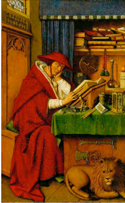
Abb.1 Van Eyck: Hieronymus im Gehäuse 1441-1442

In Van Eycks herrlicher Version des Motivs von 1441 enthält die Gelehrtenstube des Hl. Hieronymus schon alle typischen Requisiten eines frühneuzeitlichen Labors. Neben der Paternosterschnur, den Büchern und dem Lesegestell, das allerdings immer noch im Zentrum steht, sind Sanduhr, Gefäße und Astrolabium minutiös wiedergegeben.