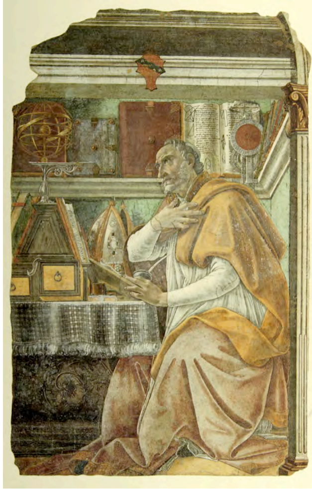
Abb.3 Botticelli: Augustinus im betrachtenden Gebet 1480

Augustinus hat im Schreiben innegehalten und blickt nun nach oben zu einem nicht sichtbaren Fenster, durch das hindurch ihn die Strahlen der Erleuchtung treffen. Er wird offenbar gerade inspiriert. Doch diese Haltung wirkt wie eine Konzession an die traditionelle Heiligenikonographie, irgendwie äußerlich und aufgesetzt. Die Utensilien in seiner Gelehrtenkammer erzählen eine ganz andere Geschichte, keine sakrale, sondern eine durch und durch weltliche. Kultgegenstände, Kreuze oder Kelche etwa, sind nirgends zu sehen. Dafür hat Botticelli auf dem Wandbild die Geräte der wissenschaftlichen Welterkundung umso sorgfältiger wiedergegeben. Die Armillarsphäre oben links und das Räderwerk der Uhr oben rechts sind bis ins Detail durchgebildet. Und ein aufgeschlagener Codex lässt, wie in einem mathematischen Lehrbuch, verschiedene geometrische Figuren erkennen. Bei diesem Raum handelt es sich nicht mehr um eine Gebetsstube. Das ist ein Ort der weltlichen Wissenschaft. Die Instrumente und Materialien, die man dafür braucht, stehen offen auf der Brüstung herum oder sind in den